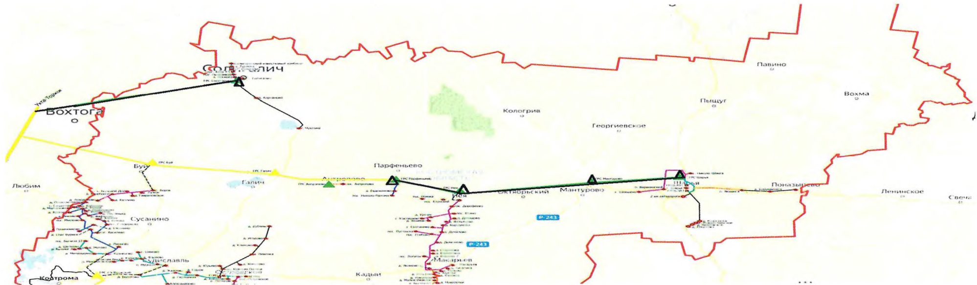
Схема 1. Расположение газопровода-отвода «Галич – Мантурово – Шарья» Костромской области, газопровода-отвода к городу Солигалич, межпоселковых газопроводов на территории муниципальных образований Костромской области

расположения объектов газоснабжения, используемых для обеспечения населения газом